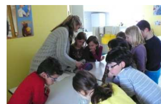
eau+ sucre : homogène

Soudain, on a observé, regardé, laissé poser, commenté