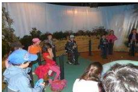
la Ludosphère: tous aux manettes