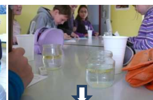
eau+ huile : hétérogène